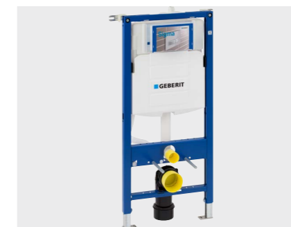
↑ INSTALLATIONSSYSTEMER Geberit Duofix indbygningssystemer og GIS installationssystemer.