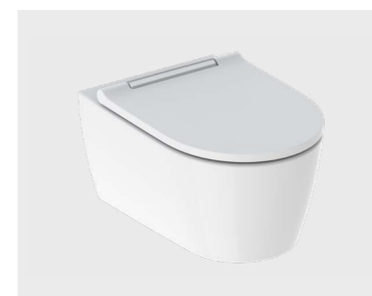
↑ GEBERIT SANITETSPRODUKTER Geberit væghængte toiletter, urinaler og håndvaske.