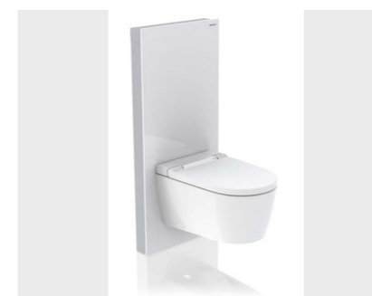
↑ MONOLITH Cisternemodul til både gulvstående og væghængte toiletter.