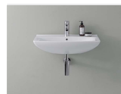
↑ IFØ SANITETSPRODUKTER Ifø gulvstående og væghængte toiletter samt håndvaske.