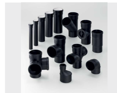
↑ AFLØBSSYSTEMER Afløbssystemer til alle behov. Silent-Pro, Silent-DB20, Silent-PP, PE og Pluvia.