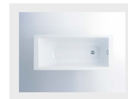
↑ BADEKAR Ifø badekar og brusekar.