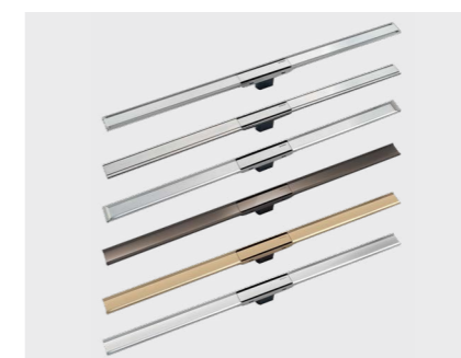
↑ GULVAFLØB CleanLine afløbsrønder og væg afløb.